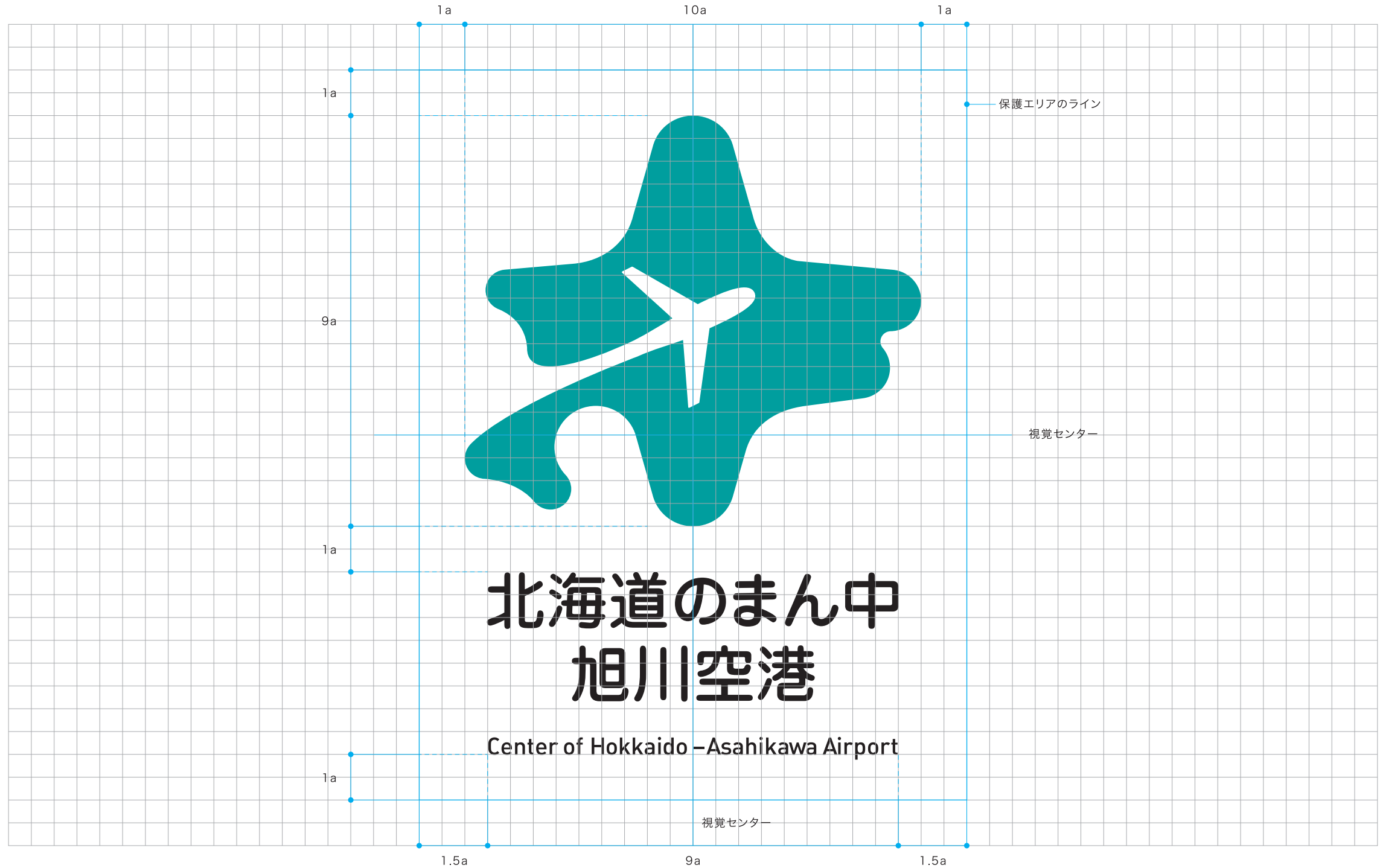
アイソレーション(保護エリア)と視覚センター位置基準