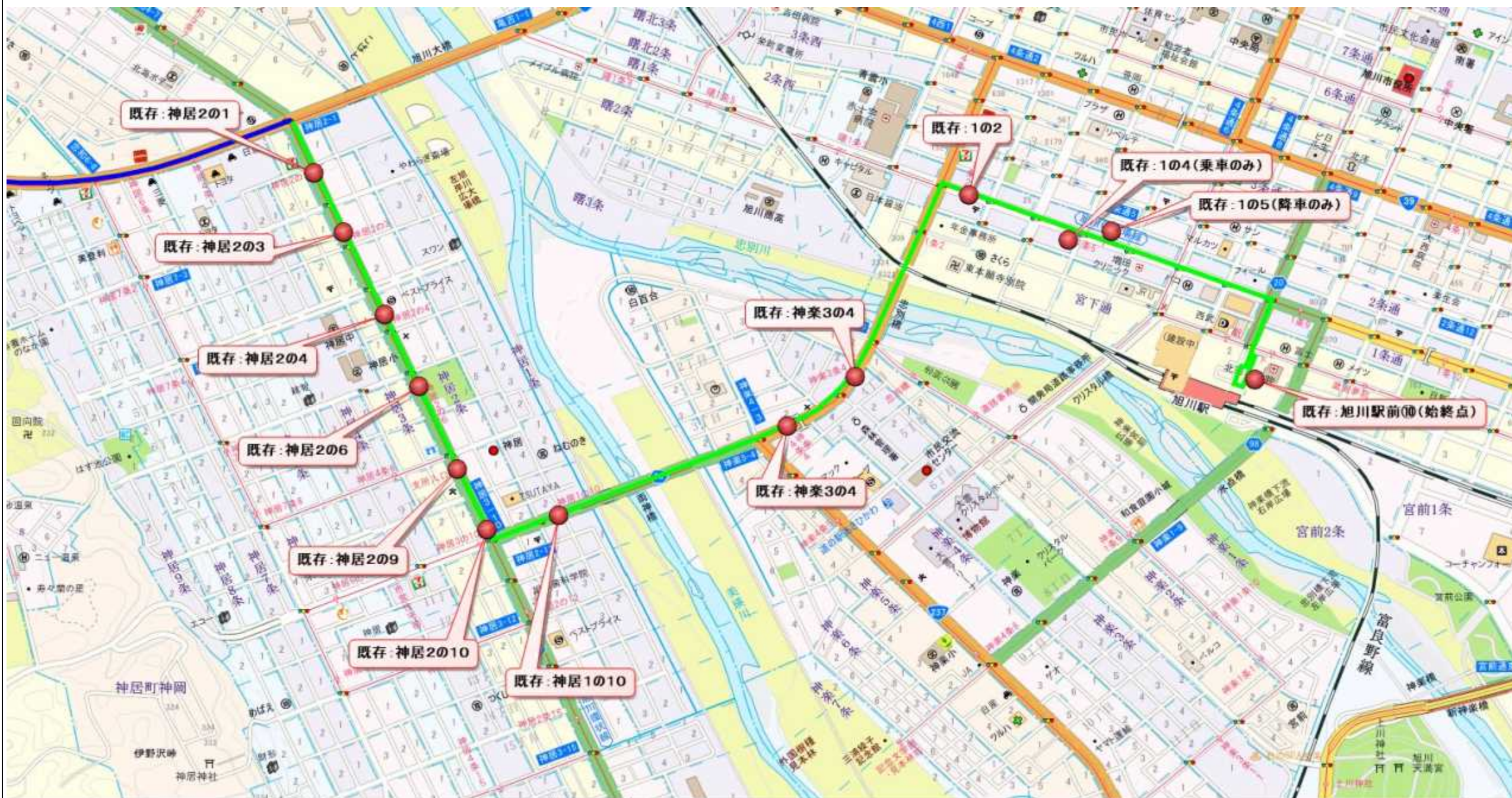
中心部片クローズ方式エリアバス停