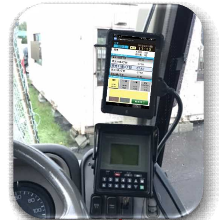
デジタルスターフ (運行指示書)