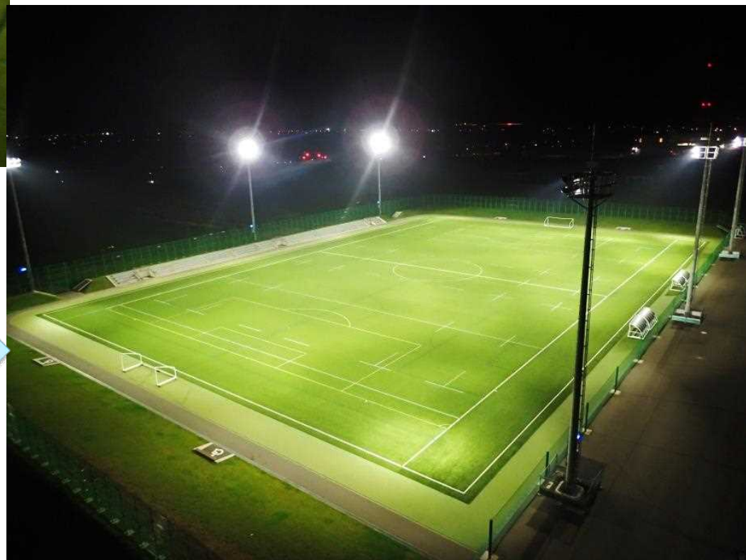
夜間の様子 (照明点灯時)