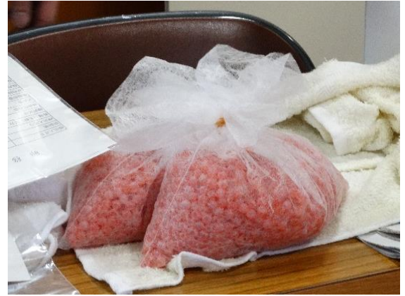
↑こんなにたくさん育てる人もいます！

10月30日うまれの160個のたまごがとどきました。たまごは水に入れずに水切りネットにいれて運ぶことができます。水の中でたまごどうしがぶつかるよりも、水に入れないで運ぶほうがたまごに傷がつかないからだそうです。