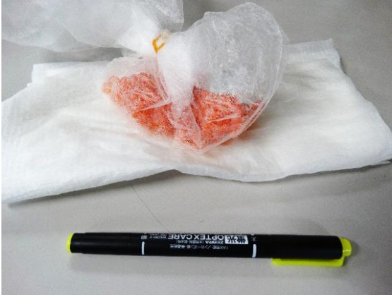
↑わたしたちが育てる160個のたまご 水にいれずにふくろに入るとどきました。

かんさつ日 平成28年12月16日(金) 室温 1度 水温 6.1度 積算温度 356.9度