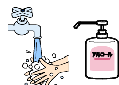
手洗い・手指消毒