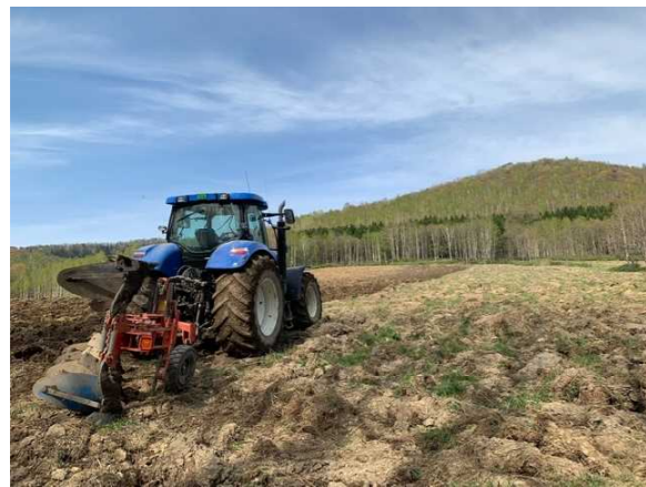
蕎麦作りの始まり

冬期間閉鎖しています、パークランド嵐山、春日青少年の家、伊勢ファームにつきましては、オープンしてからとなりますのでご了承ください。