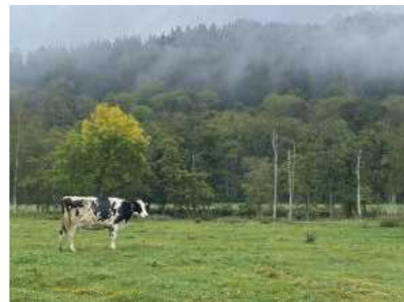
山霧 あらかわ牧場