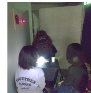
シューティングゲーム (2月)