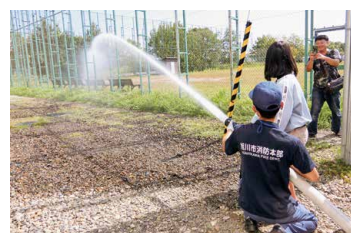
ポンプ車放水体験