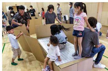
段ボールベッド組立体験