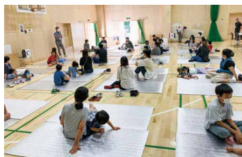
避難所での生活スペースを知ろう