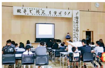
防災ミニ講話 「災害時の行動について」

当日は、防災ミニ講話のほか、防災にまつわる様々な体験メニュー（段ボールベッド・簡易トイレの組立体験ほか）に取り組みました。