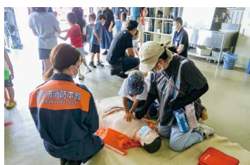
心臓マッサージ体験