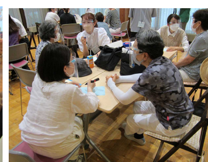
学生と参加者で話合い