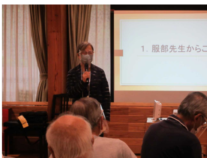
旭川医科大学 服部教授挨拶