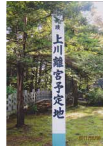
上川離宮造営予定地 標柱