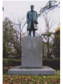
岩村通俊象 (常磐公園内)