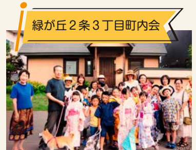
緑が丘2条3丁目町内会