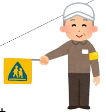
写真 「あさっぴー の横断旗」