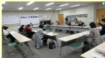
神楽まち協の会議の様子

神楽まちづくり推進協議会は、地域の課題解決に取り組むため、令和5年度は5回の会議を開催しました。議事とは別に、市からの情報提供として「地域集会施設の活用に関する実施計画における第2段階の実施」「地域学校協働活動の推進」「【仮称】第5期旭川市地域福祉計画・旭川市社会福祉協議会第7期地域福祉計画の策定」について、市の担当者からそれぞれ説明を受けたほか、旭川医科大学看護学科主催の「健康セミナー／げんき種」の参加募集や、開催当日の受付のお手伝いをしました。