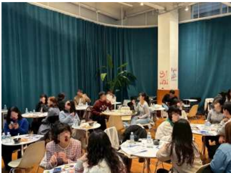
会場の様子。イベント開始前から皆さんリラックスした雰囲気でした。

イベント前半では、各地域の観光や食の魅力を紹介するプレゼンテーションが行われ、参加者の皆さんが熱心にスクリーンを見ながら話を聞く姿からも高い関心がうかがえました。