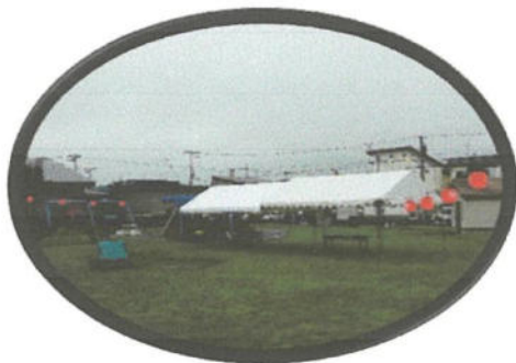
小雨の中 実行委での設営 焼き鳥作業 売店の準備