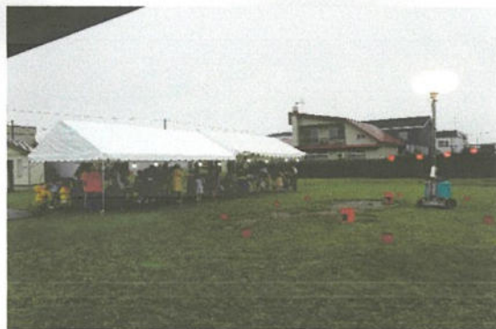
降雨の為 テントで待機