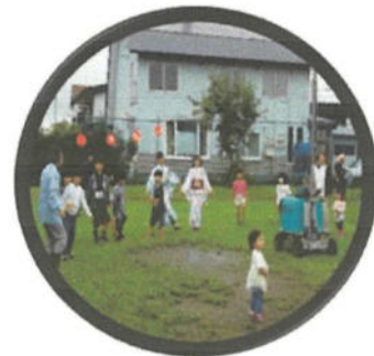
町内 谷本さん先頭で子供盆踊りスターズ 次第に大きな輪となる