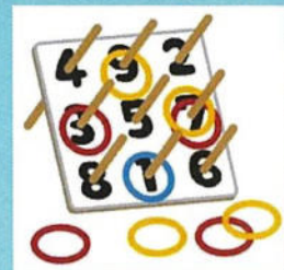
輪投げ (景品なし/好きなだけ)