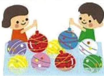
ヨーヨー釣り (1人1回)