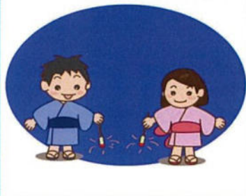
線香花火などの手持花火