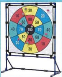
的当てゲーム (景品がなくなるまで)