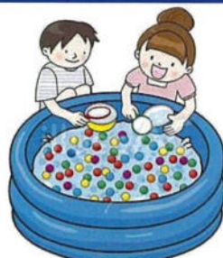
スーパーボールすくい (1人1回)