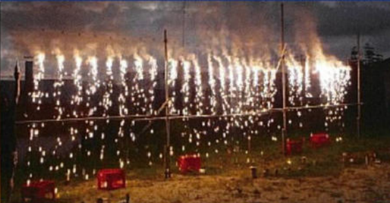
仕掛花火（ナイヤガラの滝）