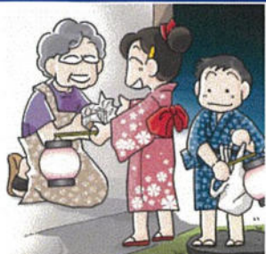
ローソクだあーせ