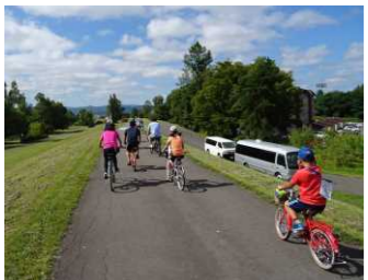
サイクリングイベント