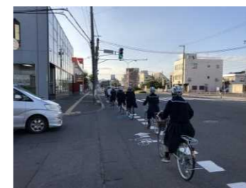
高校生の走行体験会