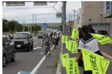
自動車運転者に向けた啓発状況