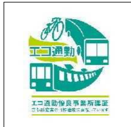
エコ通勤ロゴマーク