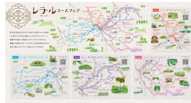
サイクリングマップ