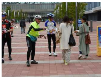
自転車交通ルールの街頭啓発