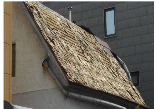
（補助対象イメージ）