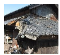
緊急代執行を要する崩落しかけた屋根