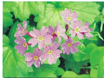
エゾオオサクラソウ