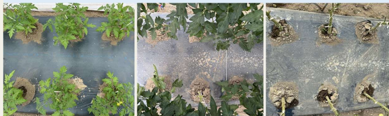
5月14日（穴あけ2日後） 7月19日（穴あけ68日後） 10月1日（穴あけ142日後）