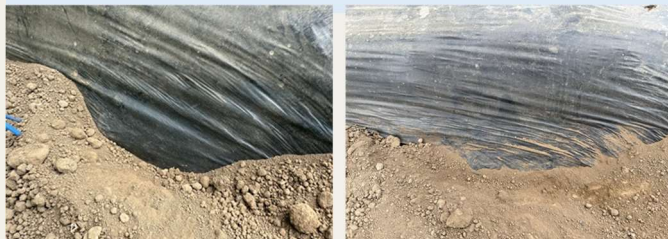
7月18日（敷設71日後） 10月1日（敷設146日後）