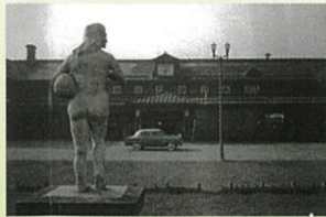
旭川駅前