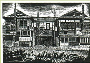
旧中島遊郭 版画/菱谷 良一