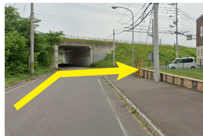
③ 架道橋トンネル手前を右折する