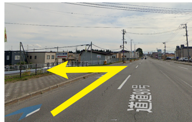
① 忠和橋を越えてすぐ左折する