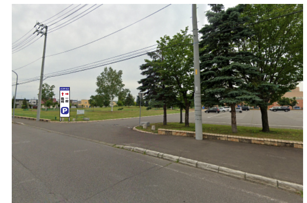
② 忠和体育館一般駐車場入口