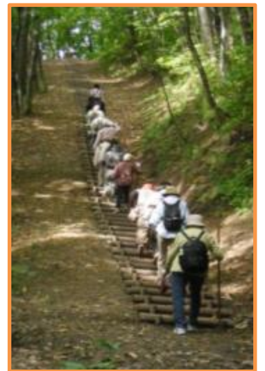
「旭山八十八ヶ所地蔵めぐり」の様子

また、東旭川公民館には5つの分館があり、瑞穂分館（旧瑞穂中学校）、日の出分館（旧第七小学校）のほか、学校併設分館（旭川第一小・旭正小・第五小）3館を運