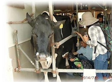
小学生と保護者対象の「親子ふれあい農業体験～乳搾り編～」