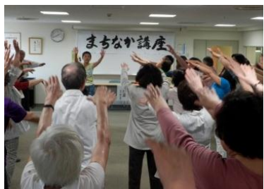
「ラフターヨガ体験」の様子

が深い」「自分でも歌える」等の感想があり、大変好評でした。 7月12日には「消費者が食品表示に話すこと」と題した講演を行いました。本講座では賞味期限や消費期限の違い、保存料をはじめとする食品添加物、原産地などについて学びました。参加者は、これからは食品の購入時には表示を確認して、安全な食生活をめざすという感想を持っていました。 7月26日には「童謡・唱歌を楽しむ交流の集い」を行いました。懐かしい童謡や唱歌をみんなで楽しく歌いました。 公民館事業課では、これからも様々な講座を予定しておりますので、ぜひご参加ください。