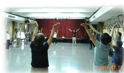
60歳以上の方対象の「脳力いきいき教室～認知症予防～」

神居公民館では、8月からも、就学前の乳幼児と保護者を対象とした「子育てサロン」や75歳以上の方を対象とした「いどばたサロン」を毎月1回開催しています。 また、介護を必要としないための「介護予防教室」や神居地区をバスで巡る「神居再発見講座」、新そばを使った「そば打ち体験」など、多くの魅力ある講座を開催します。 是非、神居公民館に足を運んでいただき、御参加ください。 お待ちしております。詳しくは、こうほう旭川市民「あさひばし」に掲載します。 なお、駐車場が狭く、お越しいただく利用者の皆さんには、ご面倒をお掛けしています。できるだけ公共交通機関をご利用しての参加をお願いします。