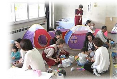
乳幼児と保護者対象の「子育てサロン」