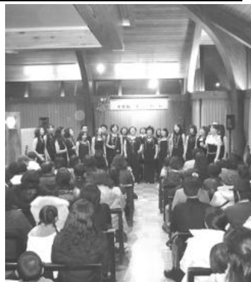
偶数月に開催される『木楽輪・夢コンサート』

また、併設されている多目的ホールは、平成21年に市民から愛称を一般公募した結果「木楽輪