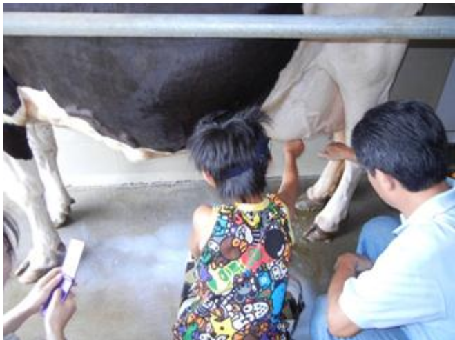
親子で乳搾りを体験する参加者

この体験講座を通して、自然に触れる機会を市民のみなさんに提供するとともに、地域の産業について知り、家庭における食に対する関心を高めるための取り組みを公民館として進めてまいります。