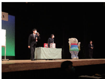
抽選会は大盛り上がり