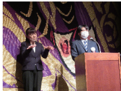
実行委員長による御挨拶