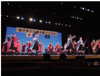
オープニングは永嶺高校によるダンプレ

旭川永嶺高校によるダンプレや、「20歳の誓い」、抽選会などが行われ、つどいには約2,000人が参加しました。