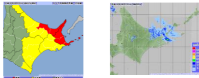
～雨の強さと災害の発生状況～