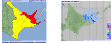
～雨の強さと災害の発生状況～

○まずはテレビやラジオ等で気象情報を確認しましょう。 ○雨が強くなってきたら、電話やインターネットでも確認しましょう。 ☆インターネットによるサービス 北海道防災情報ホームページ http://www2.bousai-hokkaido.jp/pc/(3gwm5f45lw2zxo2gf4iems55)/index.aspx 気象庁ホームページ http://www.jma.go.jp/jma/ ☆携帯電話によるサービス 北海道防災情報ホームページ http://www2.bousai-hokkaido.jp/mobile