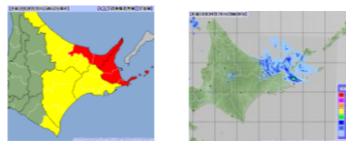
～雨の強さと災害の発生状況～