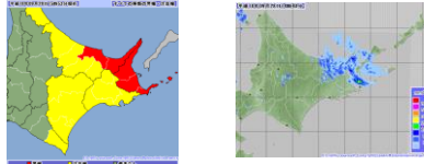
～雨の強さと災害の発生状況～