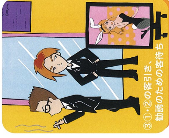
③①・②の客引き、勧誘のための客待ち