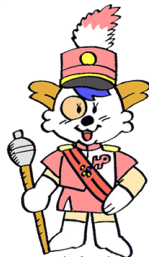
北海道警察マスコット ほくとくん