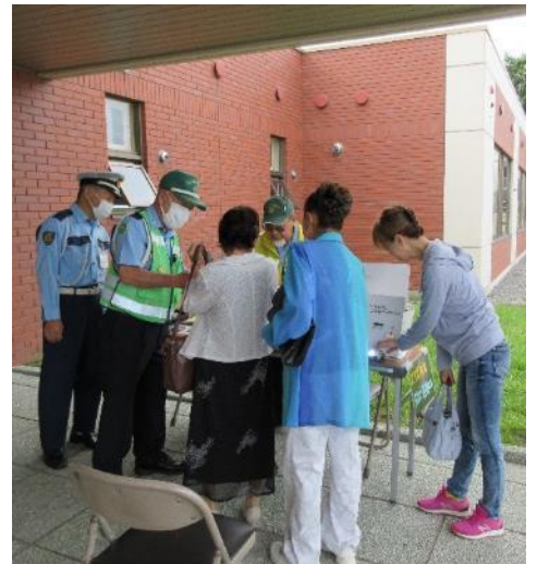
『反射材直接貼り付け活動』 旭星地区敬老祝賀会(9/16)