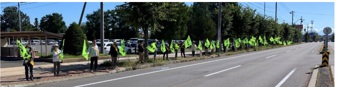
神楽地区交通安全協会「秋の交通安全旗波運動」(9/24)