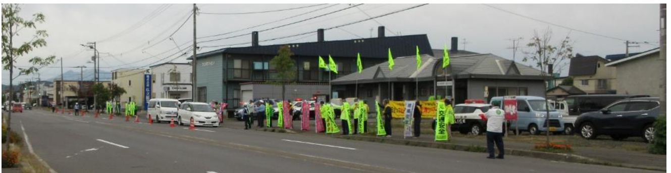
東旭川地区交通安全街頭啓発活動(9/21)