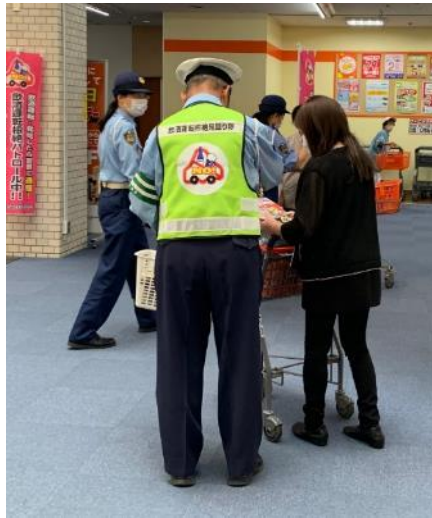
『飲酒運転根絶見廻り隊』 アール・ヨック ソグ センター(9/13)