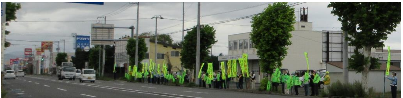
永山地区交通安全協会黄色い旗の波街頭啓発(9/20)