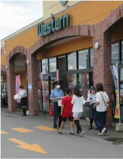
『飲酒運転根絶見廻り隊』 ウェスタン川端(8/13)