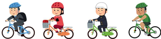
令和4年中道内自転車事故死傷者数のうち ヘルメット着用者・非着用者割合