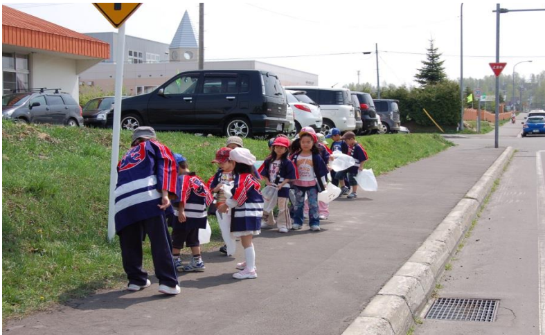
(防火広報及びゴミ拾い 鷹栖町幼年消防クラブ)

年1回，鷹栖町内において防火広報の実施と同時に放火の原因の可能性となるゴミを拾い，火災予防の呼びかけを行っている。