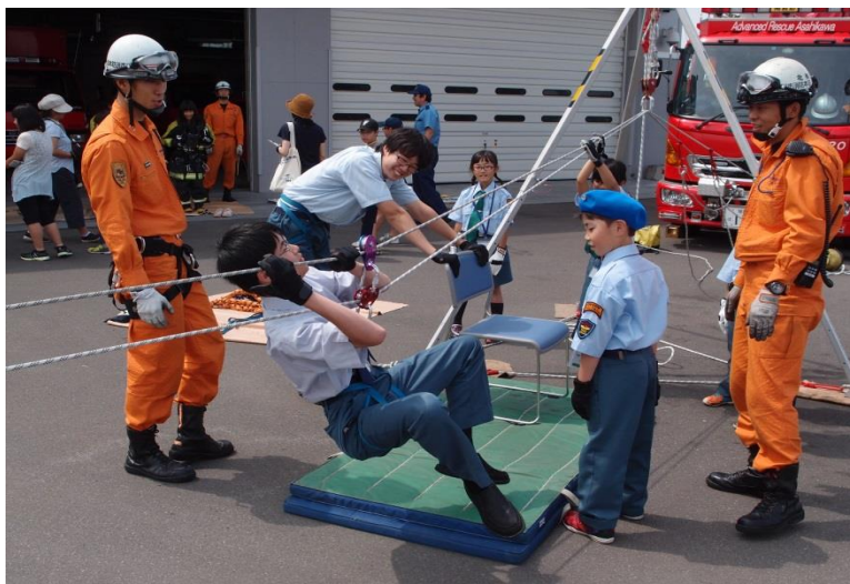
(体験ミーティング 旭川市少年消防クラブ)

少年期における防火意識を高めるとともに、消防の業務に対する理解を深めることを目的として開催している。