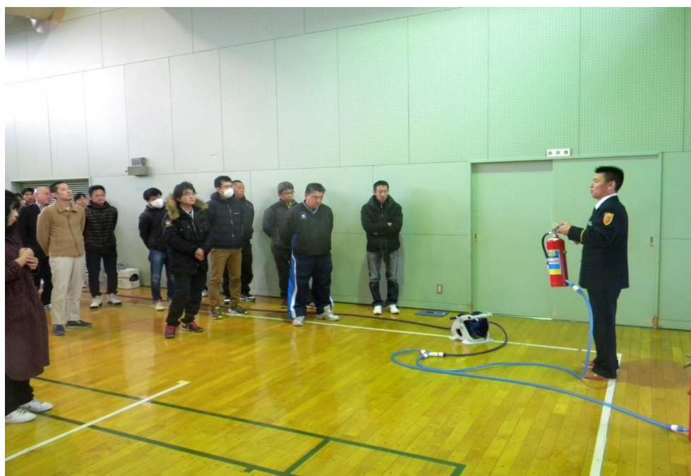
(甲種防火管理新規講習)