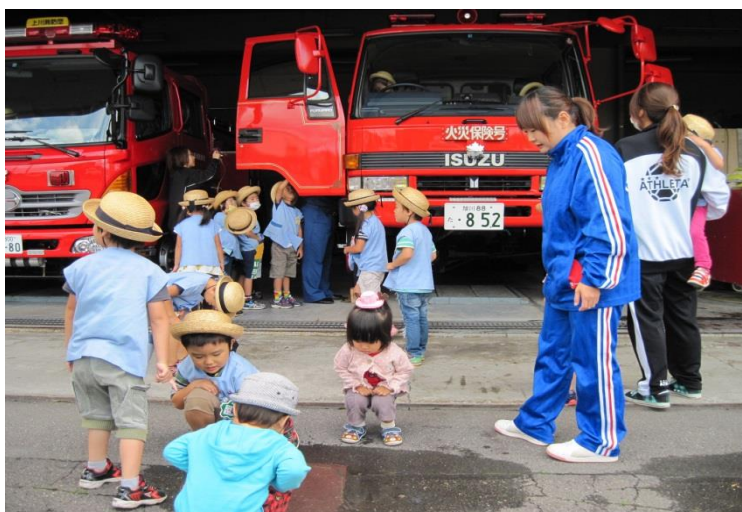
(消防署見学 上川町幼年消防クラブ)