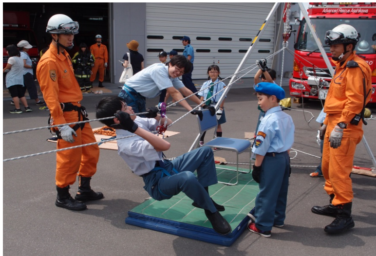
(体験ミーティング 旭川市少年消防クラブ)

少年期における防火意識を高めるとともに、消防の業務に対する理解を深めることを目的として開催している。