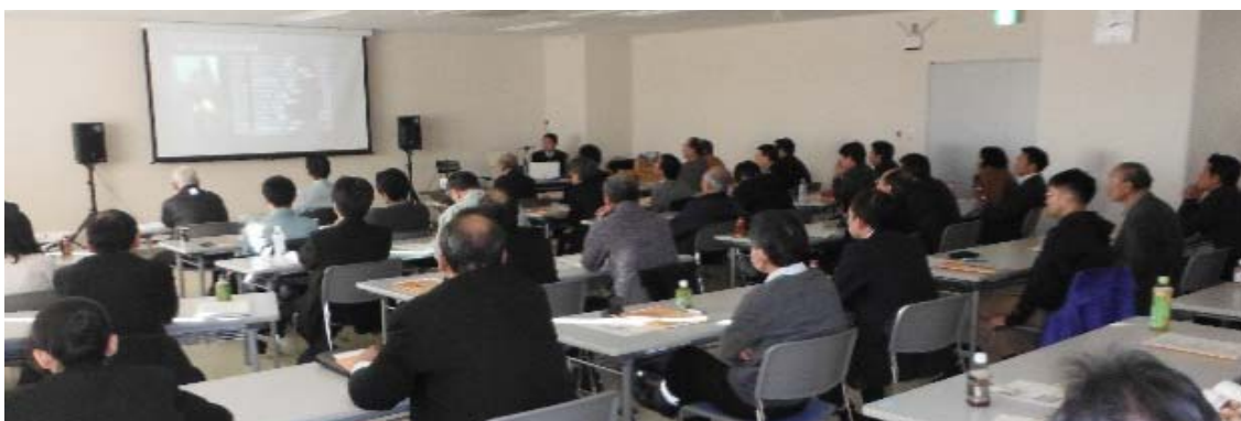
(甲種防火管理再講習)