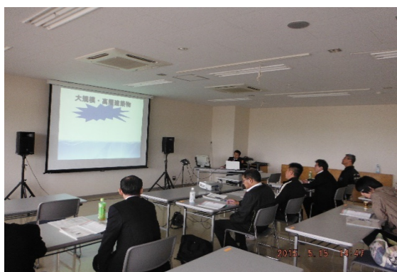
(防災管理新規講習)