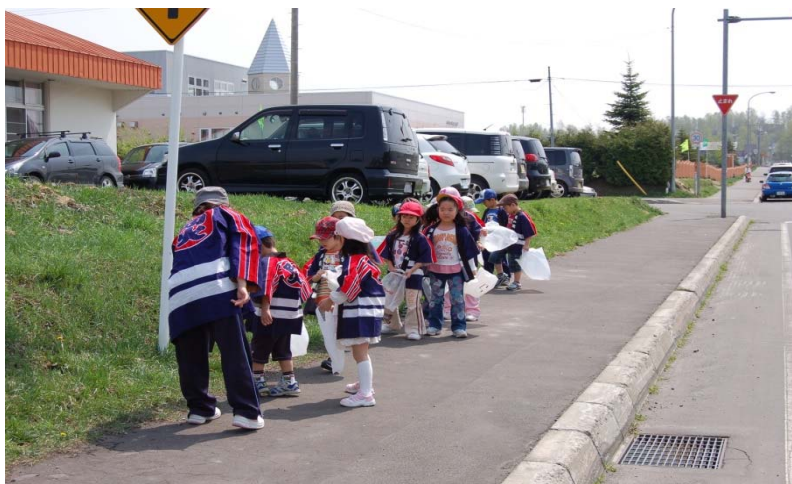
(防火広報及びゴミ拾い 鷹栖町幼年消防クラブ)

年1回、鷹栖町内において防火広報の実施と同時に放火の原因の可能性となるゴミを拾い、火災予防の呼びかけを行っている。