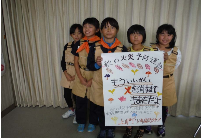
(秋の火災予防運動協力行事 上川町少年消防クラブ)

秋の火災予防運動期間中にクラブ員が火災予防ポスターを作成。上川町内事業所へ掲示依頼をし、火災予防の呼びかけを行っている。