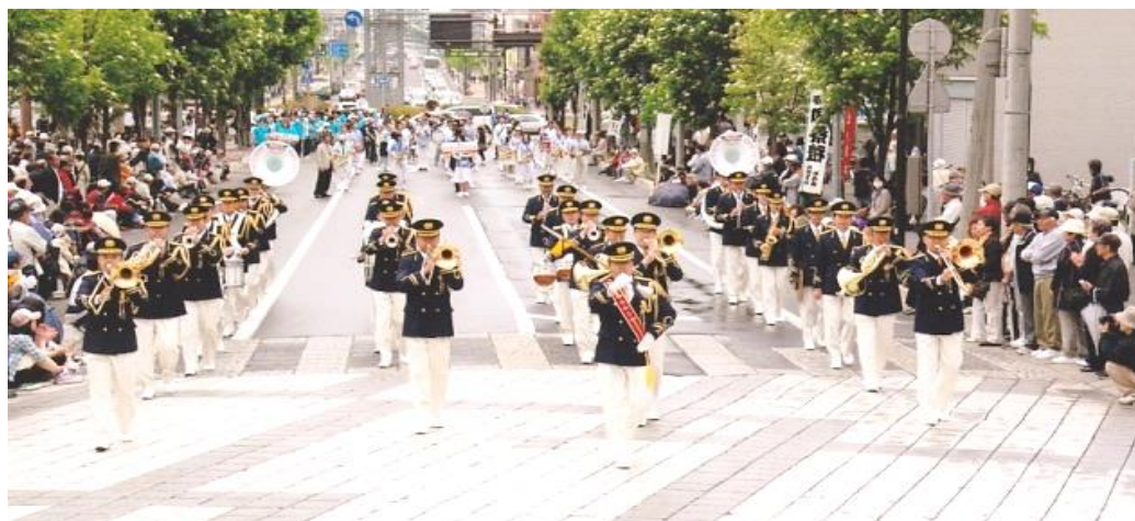
(北海道音楽大行進)