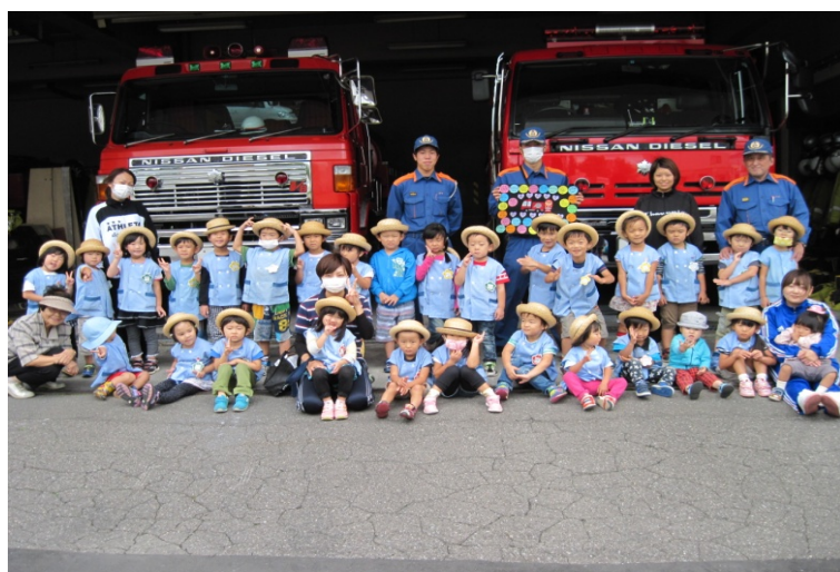
(消防署見学 上川町幼年消防クラブ)

消防署で消防車や資器材を見学した。 各車両の説明や、消防職員の仕事についての話を聞いた。