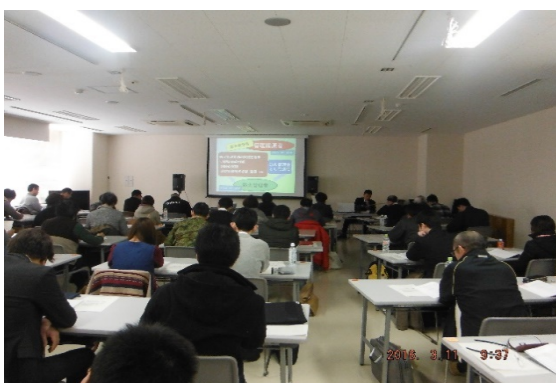
(甲種防火管理新規講習)