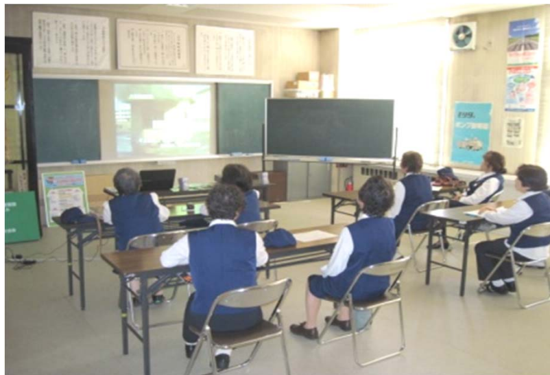
(学習会 上川町婦人防火クラブ)

定期的に学習会を開催し、防火、防災、救急等の知識を習得している。写真は防火に関するDVDを視聴している。