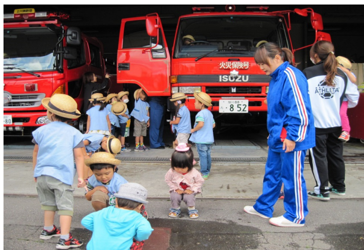
(消防署見学 上川町幼年消防クラブ)