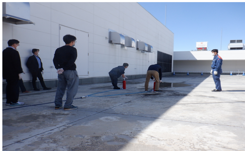
(甲種防火管理新規講習)