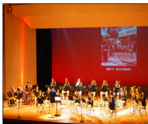
(旭川市消防音楽隊創設70周年記念演奏会) ～避難訓練コンサート～