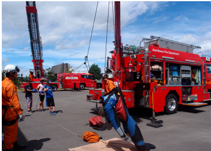
(体験ミーティング 旭川市少年消防クラブ)

少年期における防火意識を高めるとともに、消防の業務に対する理解を深めることを目的として開催している。 (休止中)