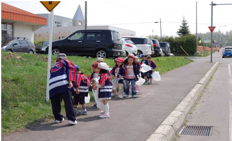
(防火広報及びゴミ拾い 鷹栖町幼年消防クラブ)

年1回、鷹栖町内において防火広報の実施と同時に放火の原因の可能性となるゴミを拾い、火災予防の呼び掛けを行っている。