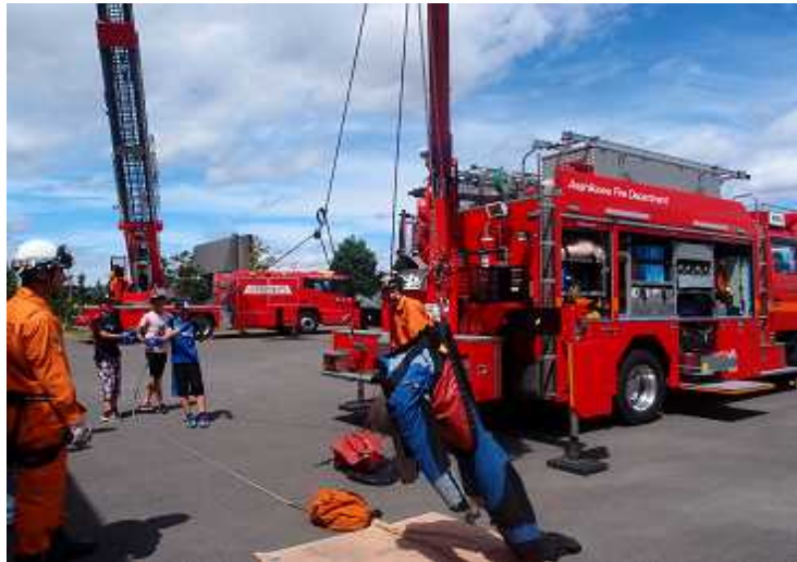
(体験ミーティング 旭川市少年消防クラブ)

少年期における防火意識を高めるとともに、消防の業務に対する理解を深めることを目的として開催している。