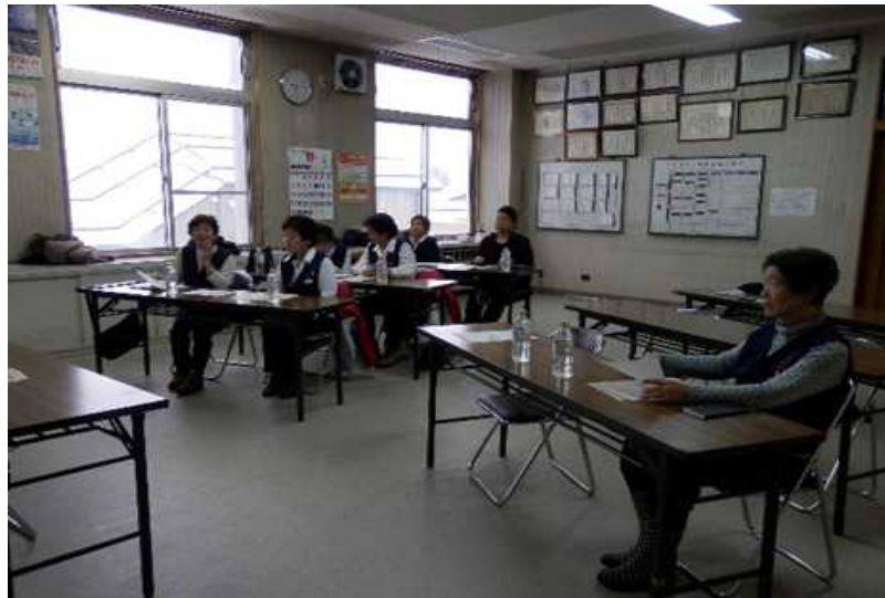
(学習会 上川町女性防火クラブ)