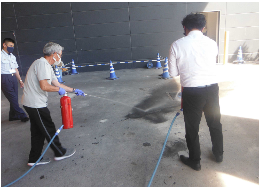
(甲種防火管理新規講習)