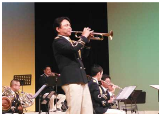
(119オータムフェア2019) ※2021年は中止のため