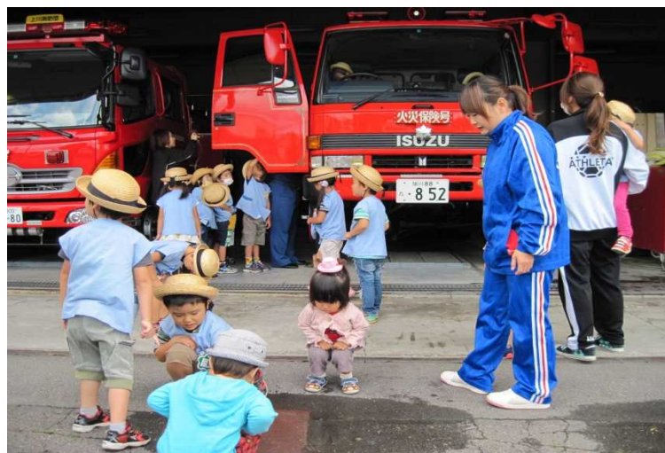
(消防署見学 上川町幼年消防クラブ)