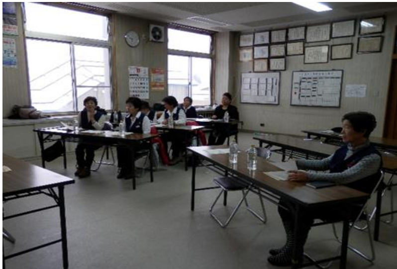
(学習会 上川町婦人防火クラブ)