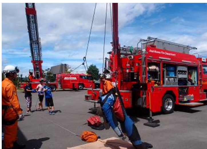
(体験ミーティング 旭川市少年消防クラブ)

少年期における防火意識を高めるとともに、消防の業務に対する理解を深めることを目的として開催している。