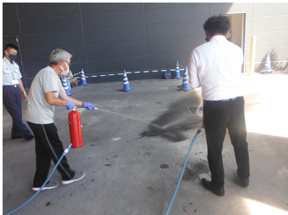
(甲種防火管理新規講習)