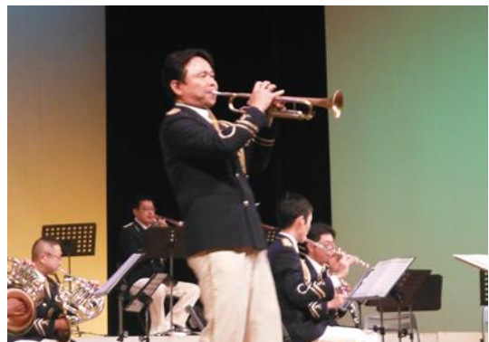
(119オータムフェア2019) ※2020年は中止のため