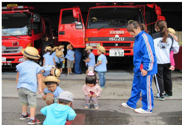
(消防署見学 上川町幼年消防クラブ)