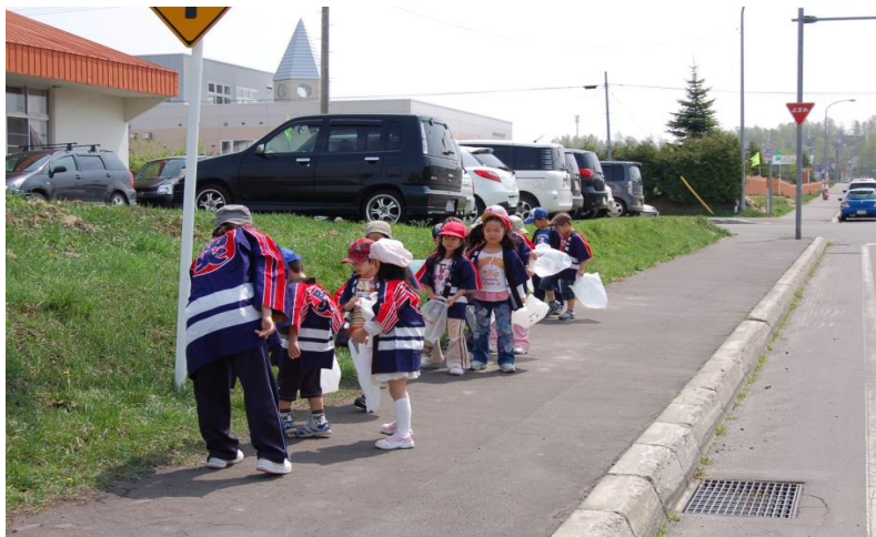
(防火広報及びゴミ拾い 鷹栖町幼年消防クラブ)

年1回、鷹栖町内において防火広報の実施と同時に放火の原因の可能性となるゴミを拾い、火災予防の呼び掛けを行っている。