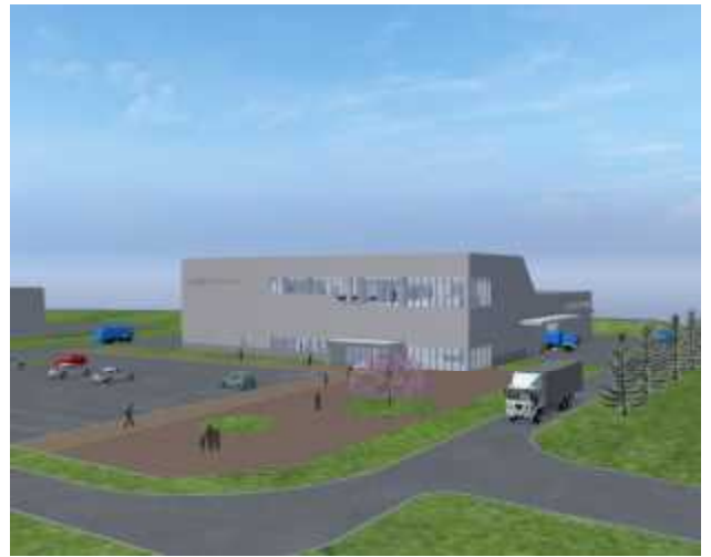
新施設の完成予想図

今後、このニュースレターにおいて、建設工事の進捗状況などを近隣地域の皆様にお知らせします。