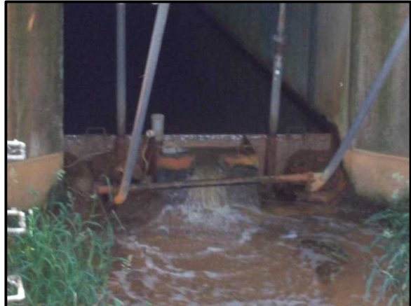
浸出水出口 (2, 3期分)