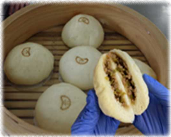
【レシピ例】 あったか旭川まん(アスパラ肉まん) 提供:北海道旭川農業高等学校中華まん班

「残り物食材の活用」 「リメイク料理」 「大量消費・まるごと食べきり」 「捨てがちな食材の活用」 どれでもOK! 食品ロスの取組も入れてね!