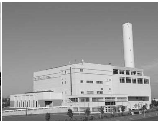
【旭川市近文清掃工場】