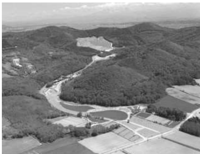
【旭川市廃棄物処分場】