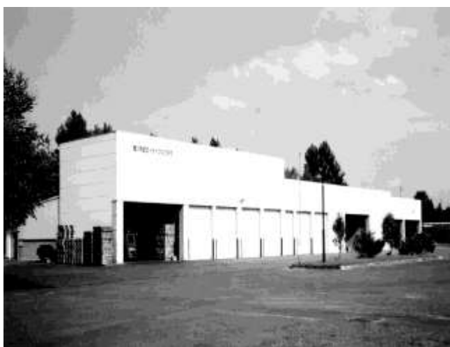
【旭川市近文リサイクルプラザ】