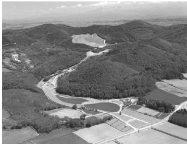
【旭川市廃棄物処分場】