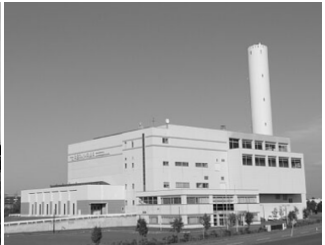
【旭川市近文清掃工場】