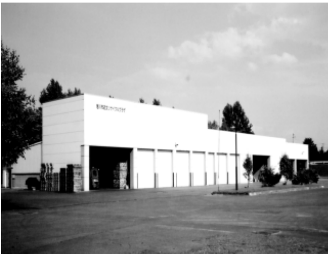
【旭川市近文リサイクルプラザ】