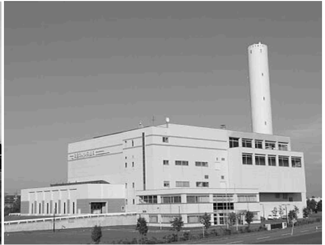
【旭川市近文清掃工場】