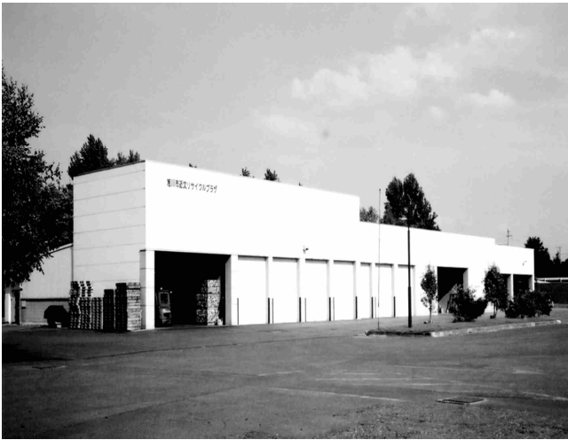
【旭川市近文リサイクルプラザ】