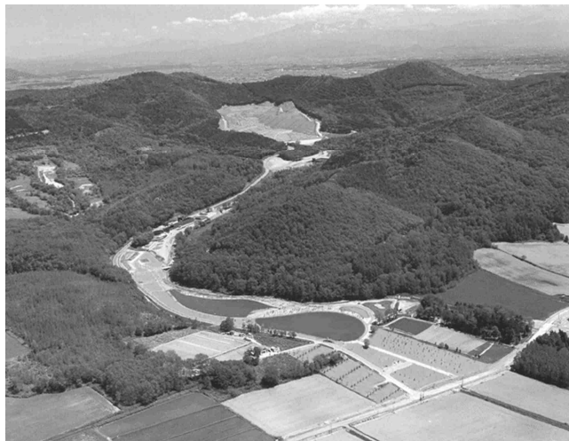
【旭川市廃棄物処分場】