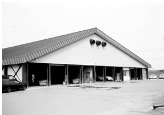
クリーンセンター車庫