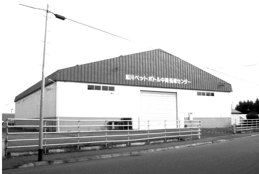
旭川ペットボトル中間処理センター