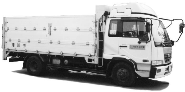
平ボディトラック