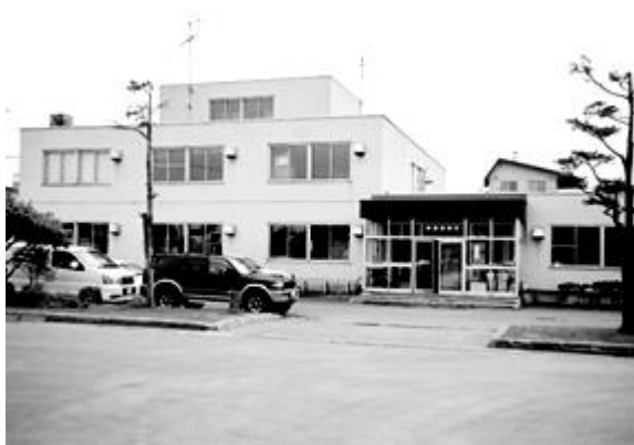
クリーンセンター管理事務所