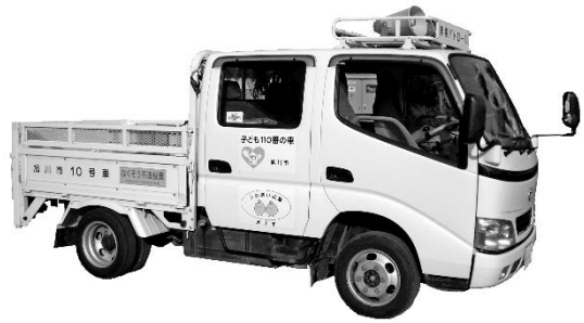
ふれあい収集専用車