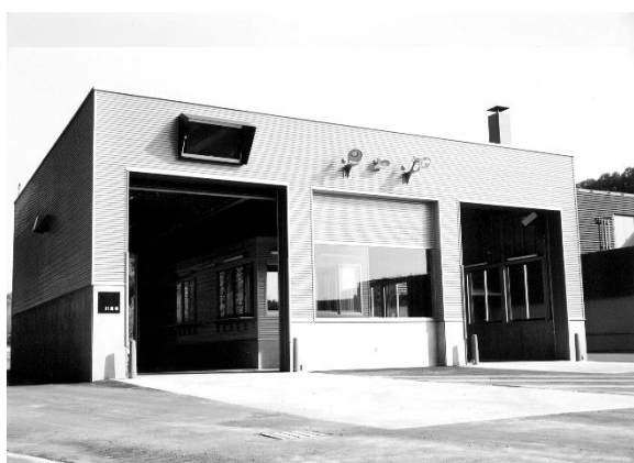
廃棄物処分場料金所