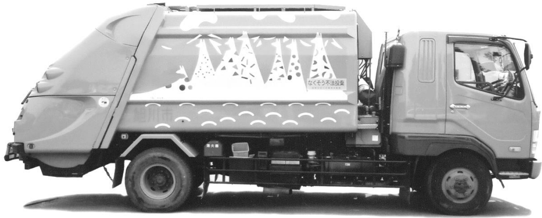
プレスパッカー車