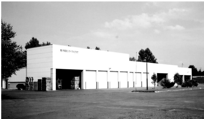
近文リサイクルプラザ