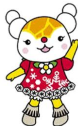
旭川市キャラクター