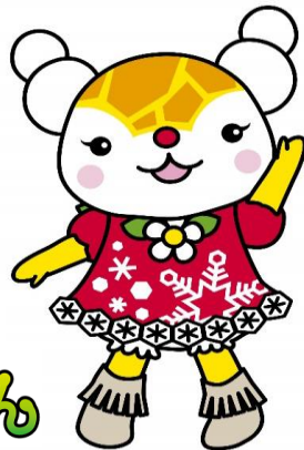
旭川市キャラクター