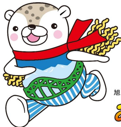
旭川市シンボルキャラクター