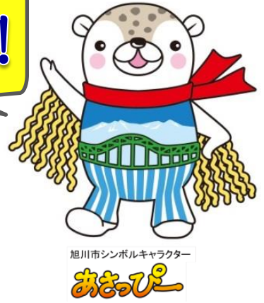
旭川市シンボルキャラクター あさび