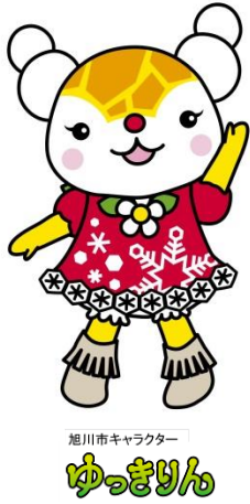
旭川市キャラクター ゆっきりん