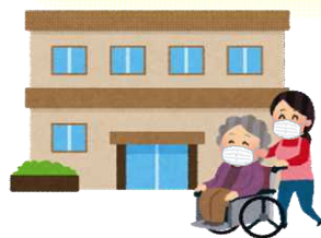
高齢者施設など に行くとき