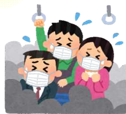
混雑した乗り物の中